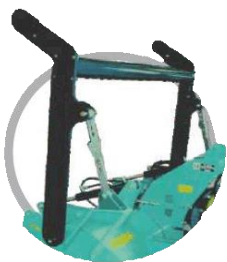
Механічна/гідравлічна регульована рамка

СДВОЕННЫЕ, СМЕННЫЕ ПРОТИВОРЕЖУЩИЕ ПЛАСТИНЫ ИЗ ИЗНОСОСТОЙКОГО МАТЕРИАЛА