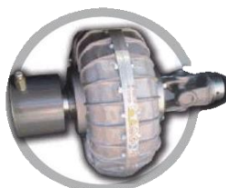
Комплект гідравлічних муфт Fighter