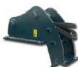
Система швидкої зчипки з опорою