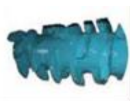
Ротор з фіксованими молотками для мод.1200/1500/1800