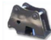
Система швидкої зчипки

Умови оплати і постачання. Аванс 30 %, доплата 70% по готовності. За відсутності на складі, термін виготовлення максимум до 8 тижнів.