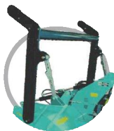
Механічна/гідрравлічна регульована рамка