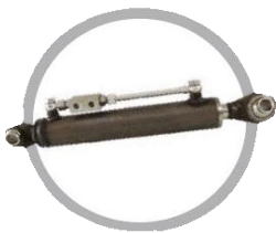
Третя гідрравлічна точка REF