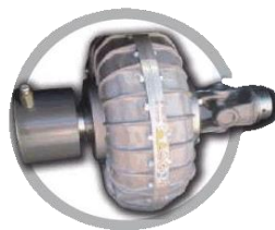
Комплект гідрравлічних муфт Tekken