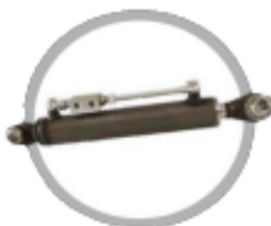
Третя гідравлічна точка REF

Умови оплати і постачання. Аванс 30 %, доплата 70% по готовності. За відсутності на складі, термін виготовлення до 8 тижнів.