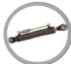
Третя гідравлічна точка REF

Умови оплати і постачання. Аванс 30 %, доплата 70% по готовності.