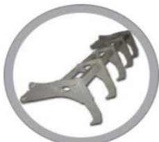
Гідравлічна регульована рамка