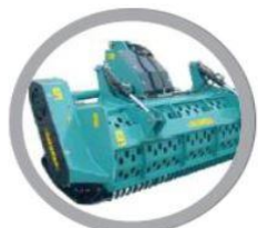
Решітка для подрібнення продукту