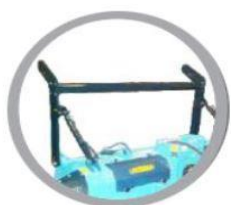
Механічна/гідравлічна регульована рамка