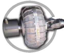
Комплект гідравлічних муфт Fighter