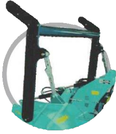
Механічна/гідравлічна регульована рамка